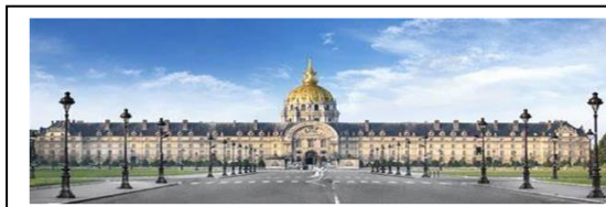
Hôtel National des Invalides